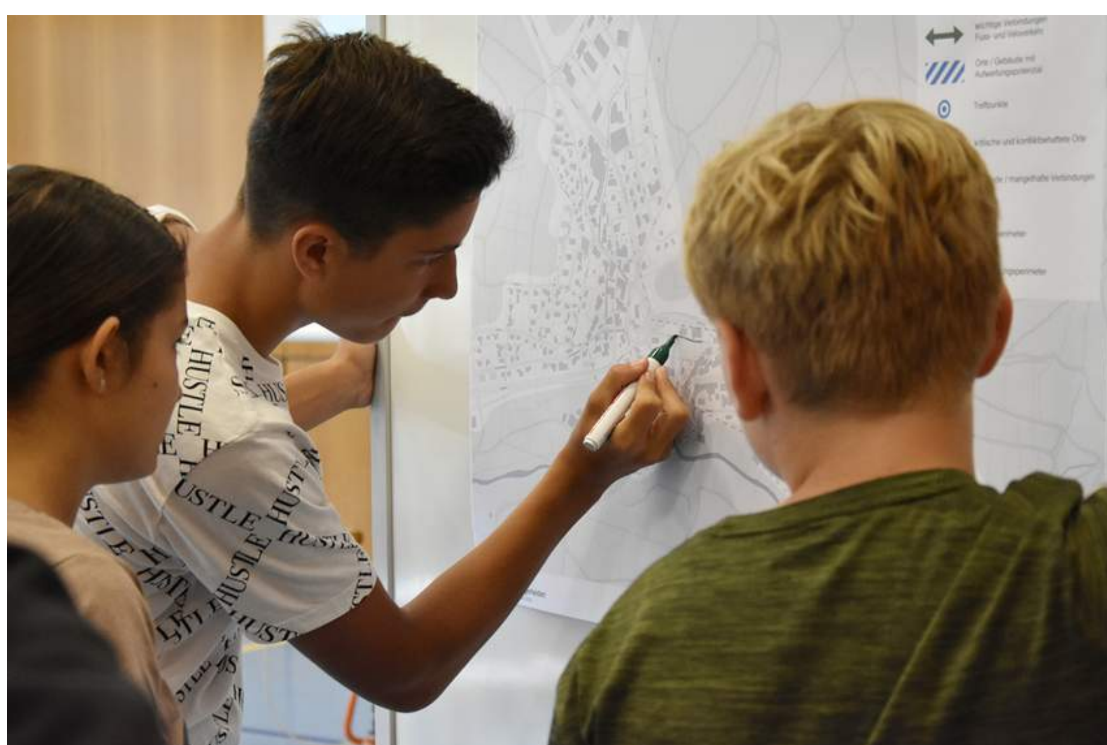
Mit bunten Stiften zeichnen die Jugendlichen wichtige Punkte auf dem Ortsplan ein

Das Dorfzentrum Tegerfelden soll umgestaltet werden. In einem Workshop durfte die Bevölkerung - Wünsche äussern - und überraschte mit ihren Inputs!