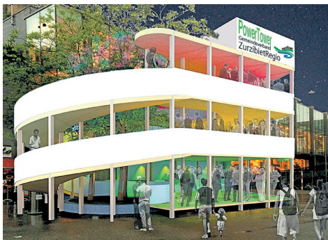
Mit der dreistöckigen Beiz «PowerTower» möchte das Zurzibiet an die Badenfahrt 2017.

Noch ist es aber nicht so weit. Im Augenblick heisst es abwarten und hoffen, dass Konzept und Standort beim OK der Badenfahrt auf Goodwill stossen. Den definitiven Bescheid gibt es voraussichtlich im September 2016. Eine erste Rückmeldung von offizieller Seite enthielt immerhin eine Gratulation zum gelungenen Konzept.